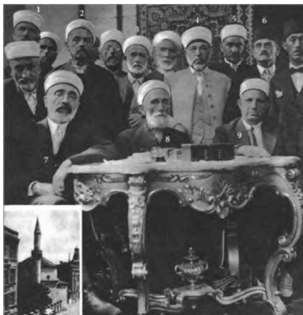
Kurija za izbor reisu-l-uleme u Beogradu 1930. godine.