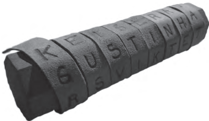
Slika 1. Skital s namotanom vrpcom i porukom