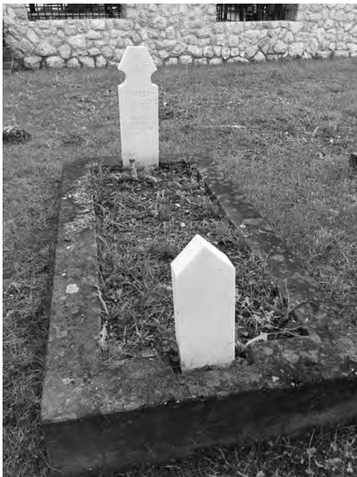
Mezar muftije Derviš-ef. Šećerkadića

Ukopan je u haremu Husein-pašine džamije, gdje mu se i danas nalazi mezar.