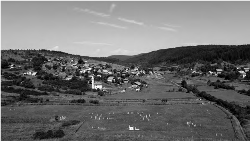
Panorama Košutice