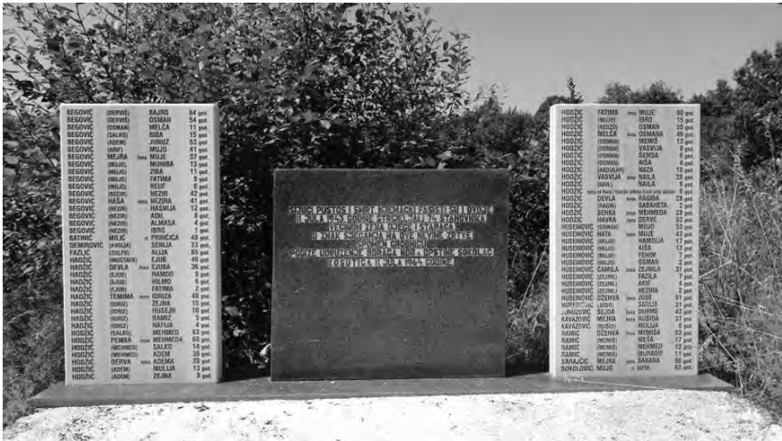
Spomen-obilježje ubijenim Bošnjacima u Košutici

Nekoliko dokumenata pronađenih u arhivi Ulema-medžlisa otkrivaju napore rukovodstva Islamske zajednice da se zločin dokumentira. U ovom radu podsjetit ćemo na detalje pokolja u Košutici i u Orašlju. Oba su se desila istoga dana na dva različita kraja zemlje od strane pripadnika iste njemačke SS divizije. 3